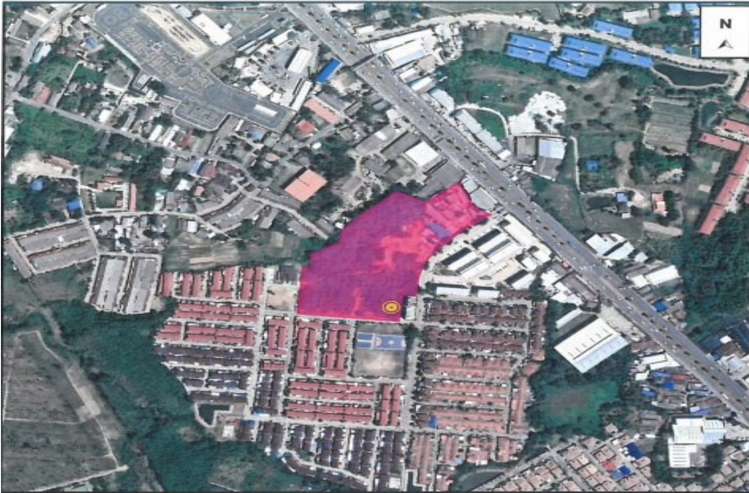
รูปที่ 1.2-1 ตำแหน่งที่ตั้งโครงการ